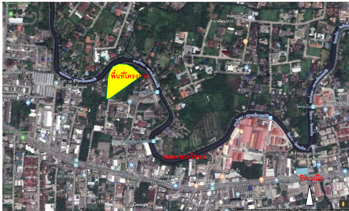
ภาพที่ 1 จุดที่ตั้งพื้นที่โครงการ